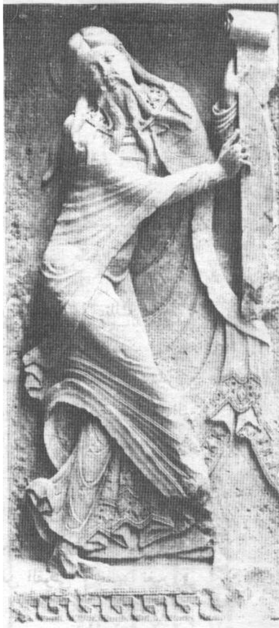
پهیکه ریک لهسه ر دیواری کلیسای سویلاک، نهشعه یا په یامبهر Swilac